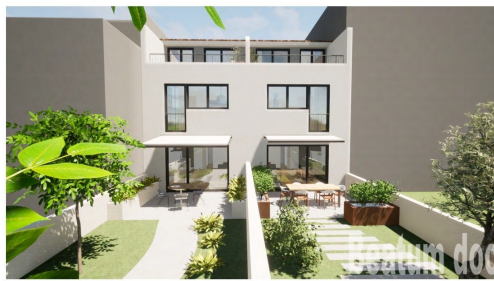
House with two residential units Kuća sa dvije stambene jedinice