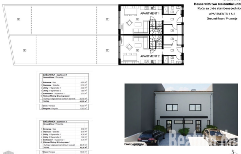
House with two residential units Kuća sa dvije stambene jedinice APARTMENT 1 & 2 Ground floor / Prizemlje

Dual House im Bau, Umgebung von Poreč Im Erdgeschoss: ein Badezimmer, eine Küche, ein Esszimmer, Wohnzimmer, Terrasse Erster Stock: Zwei Zimmer, ein Badezimmer Auf dem Dachboden: ein Zimmer, ein Badezimmer Parkplatz