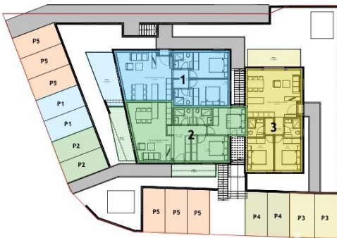
TLOCRT PODRUMA 1:100